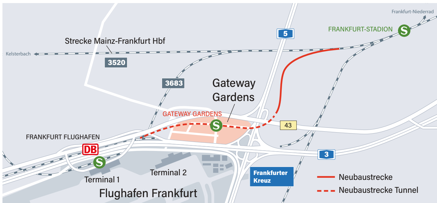
Karte Neubaustrecke Gateway Gardens

Die Inbetriebnahme der neuen S-Bahnstation in der Nähe des Frankfurter Flughafens am 15. Dezember 2019 führte zu teilweise erheblichen Fahrplanänderungen im Schienenpersonennahverkehr.