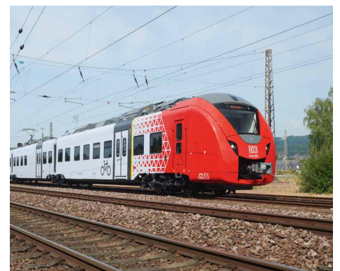
Der Coradia Continental wird in 25-facher Ausführung im Elektronetz Saar RB eingesetzt.

Die Züge, deren Höchstgeschwindigkeit 160 km/h beträgt, zeichnen sich des Weiteren durch ein hohes Beschleunigungsvermögen aus und erfüllen nach Angaben des Herstellers die neuesten europäischen Normen in puncto Sicherheit, Barrierefreiheit und Emissionswerte.