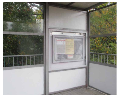
Ein deutlicher Vorher-nachher-Effekt: Im Rahmen von „Bahn aktiv“ wurden auch die Stationen Guntersblum, Neustadt-Böbig und Kaiserslautern-Pfaffwerk von Schmierereien befreit