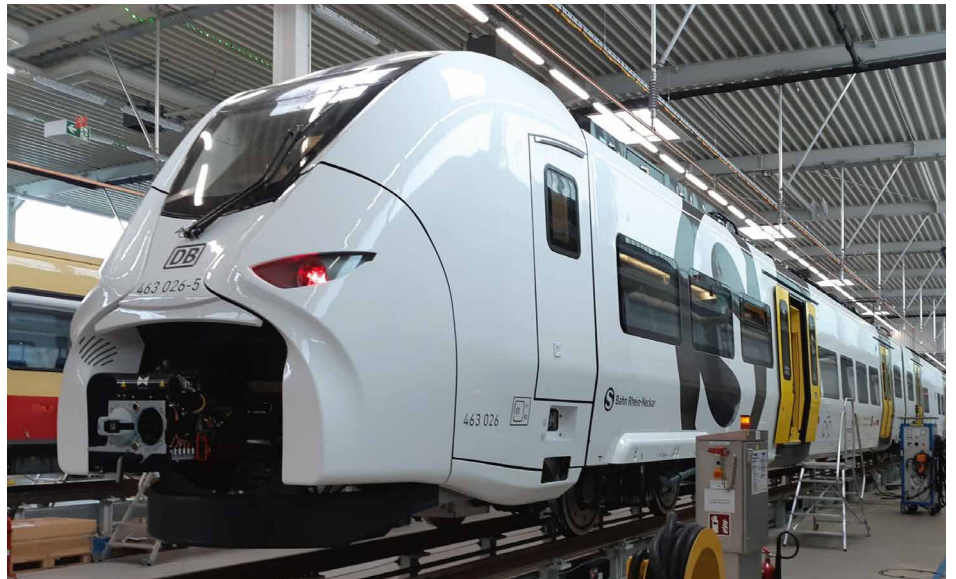
Ein Blick in die Krefelder Werkstatt: Beim Bau der 57 neuen Fahrzeuge liegt Siemens gut im Zeitplan

Die 70 Meter langen S-Bahn-Triebwagen für das Los 2 der S-Bahn Rhein-Neckar werden bei Siemens in Krefeld gebaut.