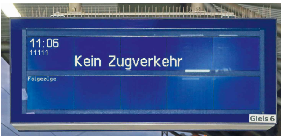
Immer wieder fallen infolge des Personalmangels Züge aus

Die angespannte Personalsituation bei den Eisenbahnverkehrsunternehmen dauert an. Insbesondere durch fehlendes Fahrpersonal kommt es auch in Rheinland-Pfalz weiterhin zu Engpässen auf der Schiene.