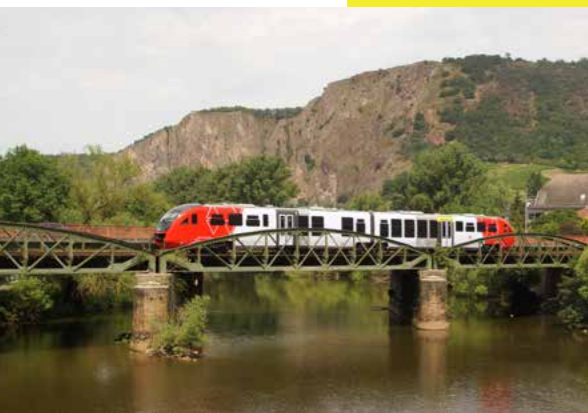
VT 642 (refreshed), Nahebrücke Bad Münster am Stein- Ebernburg

Die Aufteilung des Vergabeverfahrens Pfalznetz in zwei Lose hatte einen planerischen Hintergrund. So soll die Alsenztalbahn zwischen Kaiserslautern, Bad Kreuznach und Bingen zusammen mit anderen Strecken entlang der Nahe und in Rheinhessen als neues Netz ausgeschrieben werden. Somit können dann ab Juni 2037 durch Flügel und Kuppeln von Zügen in Bad Münster am Stein umsteigefreie Verbindungen zwischen Kaiserslautern und Frankfurt ermöglicht werden.