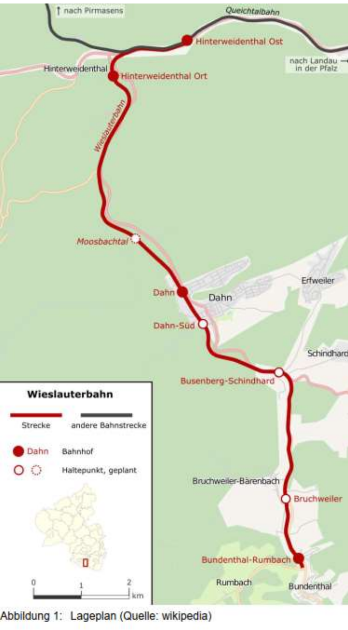
Abbildung 1: Lageplan